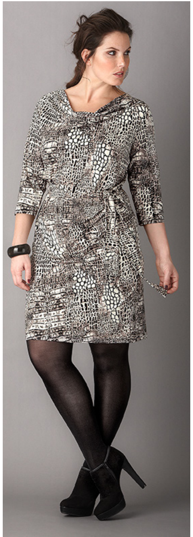
Jurk 29 99 *

*Getoonde artikelen zijn niet in alle winkels verkrijgbaar.