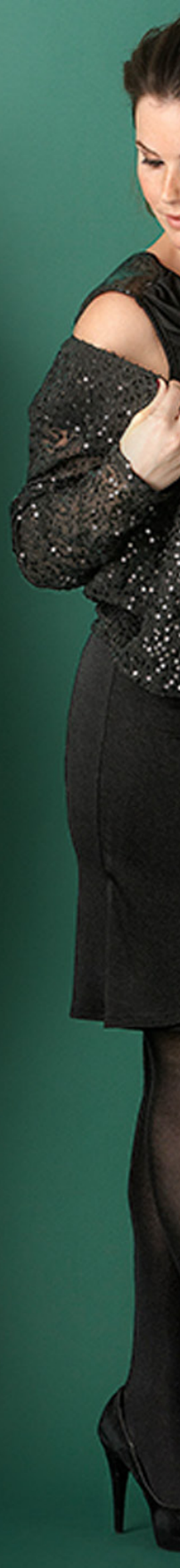
Jasje 34 99