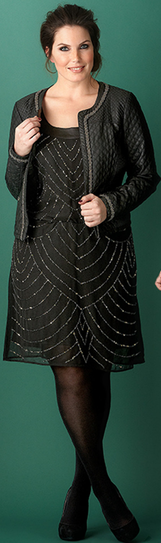
Jasje 59 99 Jurk 39 99 *