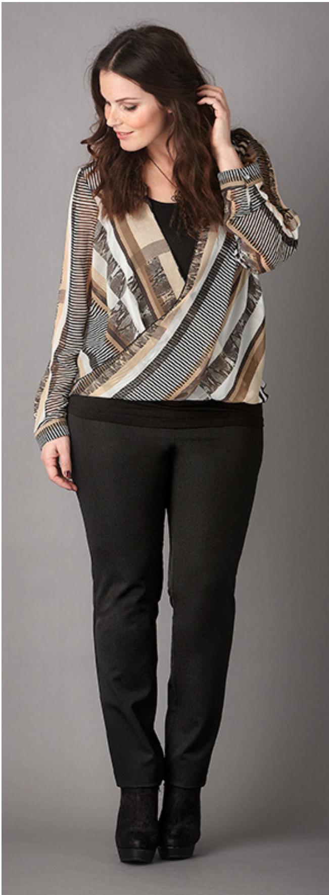
Blouse 29 99 Broek 29 99